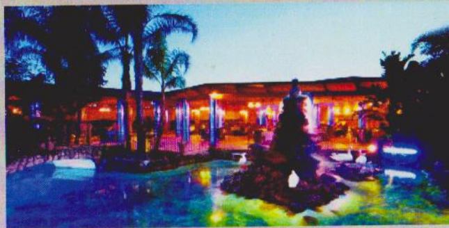
HOTEL SAN LUCA - S.S. 18 - Km. 76,500 - 84091 Battipaglia (SA)

UNIDERM FARMACEUTICI - JUST PHARMA IPFARMA - TEGEA - CADIGROUP