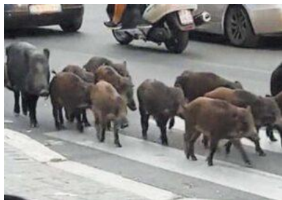
Cinghiali affamati a caccia di cibo anche nel centro abitato

Ma è stato sempre così? Quanti progetti sono stati allestiti dal territorio? In merito, gli Enti territoriali, come il Parco, le Comunità montane, i Consorzi, le Unioni dei Comuni , hanno mai presentato progetti relativamente alle risorse europee, coinvolgendo le popolazioni? Non è forse vero che le popolazioni considerano questi Enti solo come un intralcio?