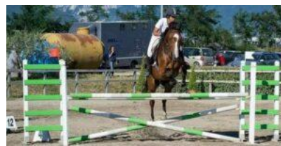
Centro Ippico tenuta Seliano

Ovviamente, la progettazione complessiva di sviluppo socio-occupazionale dev'essere analitica e puntuale, nell'ambito degli specifici settori di riferimento delle aziende turistico-ristorative, curando i rapporti con il cliente, intervenendo nella produzione, promozione e vendita dei prodotti dei servizi, valorizzando le risorse enogastronomiche secondo gli aspetti culturali, artistici e del territorio, proprio in relazione allo stesso. La Progettazione deve anche concentrarsi sulle tecnologie digitali , eventi enogastronomici e culturali che valorizzino il patrimonio delle tradizioni e delle tipicità locali , anche in contesti nazionale e internazionale, per la promozione delle specificità ambientali e culturali del territorio , con un'offerta turistica integrata con i principi dell'ecosostenibilità ambientale, promuovendo la vendita dei servizi e dei prodotti coerenti con il contesto territoriale, anche utilizzando il web.