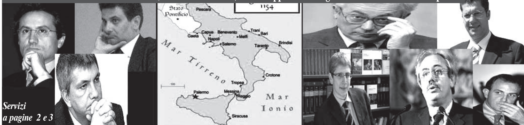
Servizi a pagine 2 e 3

Buscemi: siamo al Sud dei "miracoli"...(circa 150 movimenti) e lo sviluppo? E' un'organizzazione dell'ottocento e più...!