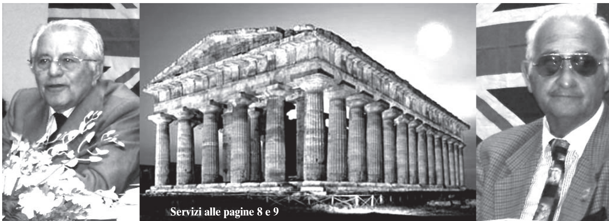
Servizi alle pagine 8 e 9

Buscemi: siamo al Sud dei "miracoli"...(circa 150 movimenti) e lo sviluppo? E' un'organizzazione dell'ottocento e più...!