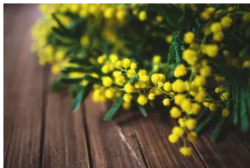
Festa delle donne: storia

S.O.S. compiti: iscriviti ai gruppi Facebook di aiuto allo studio di Letteratura, Storia e Riassunti e temi svolti!